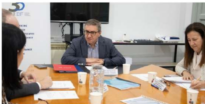
Rovira preside el Consejo Permanente y Patronato de la Fundación de Estudios Bursátiles y Financieros